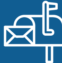
BUZÓN DE DENUNCIAS