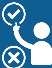
TOMA DE ACCIONES