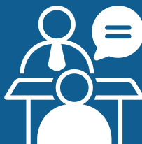
PRESENCIA EN EL ÁREA LEGAL